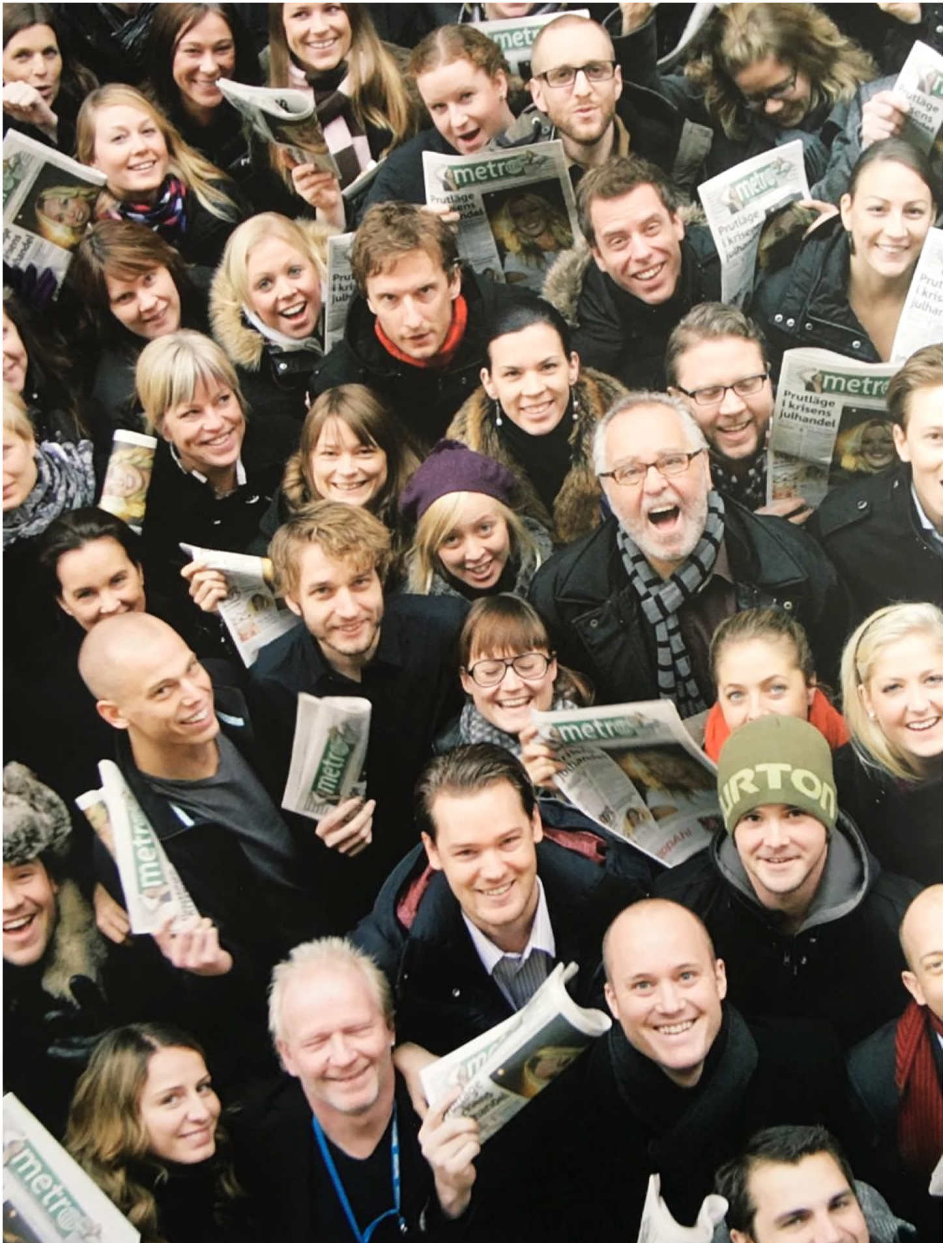
Редакция «Metro Стокгольм» с первым выпуском газеты, февраль 1995 года