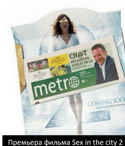
Премьера фильма Sex in the city 2