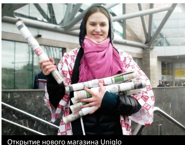
Открытие нового магазина Uniqlo